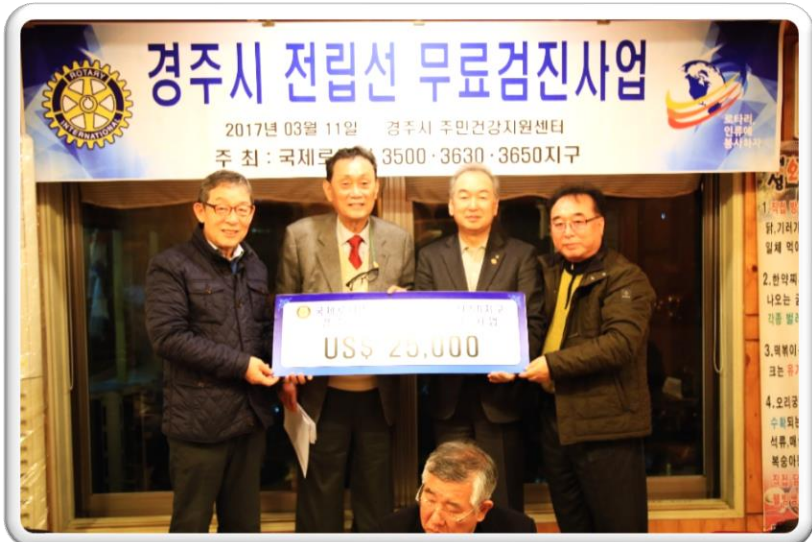
국제로타리 3650지구 클럽

2017년 3월 경북 경주시 전립선진료 국제로타리 3500,3630,3650지구