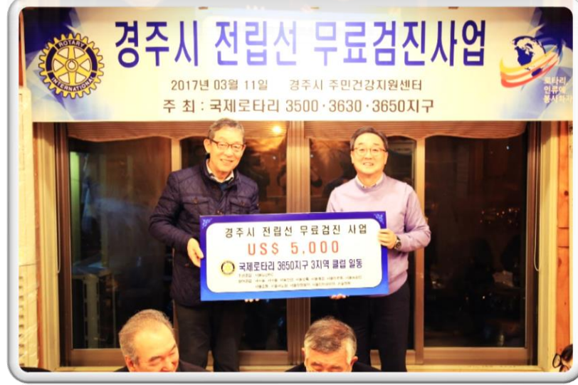
국제로타리 3650지구 3지역 클럽