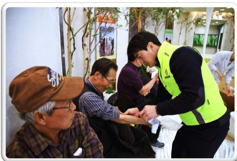
검진 안내 자원봉사