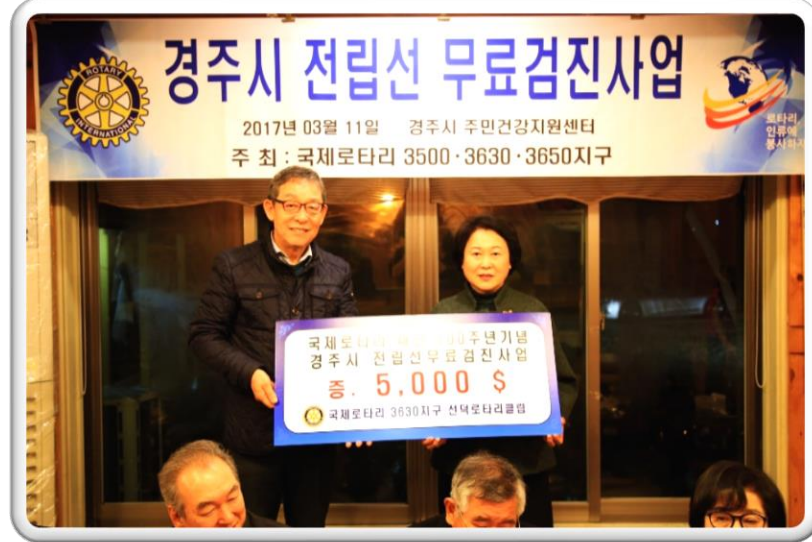
국제로타리 3630지구 선덕로타리클럽