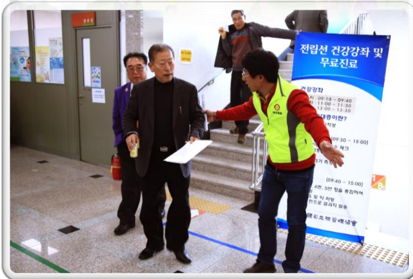
검진 안내 자원봉사