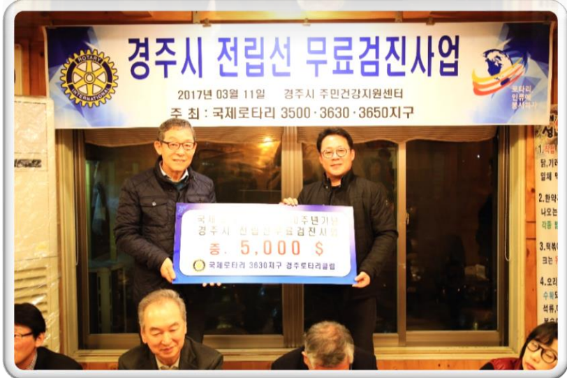
국제로타리 3630 경주로타리 클럽