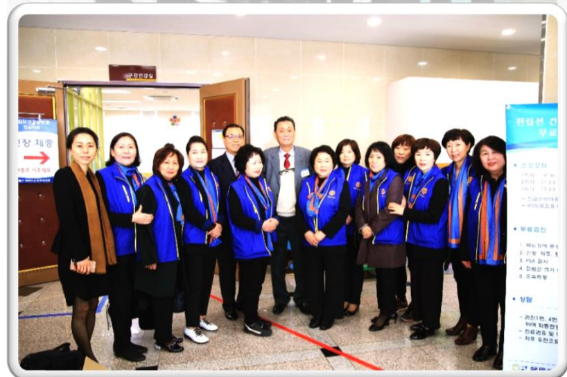
국제로타리 3630지구 경주로타리클럽